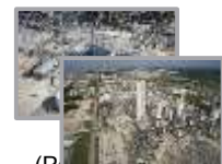
(Port Arthur) LaPorte