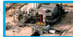
Port Arthur, Texas, modrý H 2