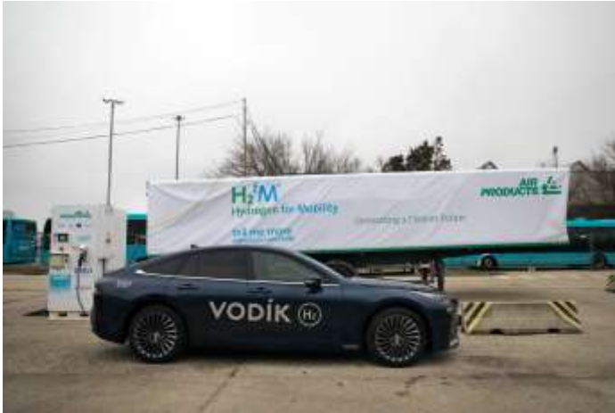
Slovenská inovační a energetická agentura Trnava, Slovakia, 2/2022