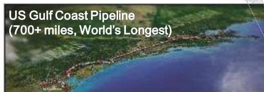
US Gulf Coast Pipeline (700+ miles, World's Longest)