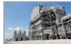
Corunna [SMR & LHY]