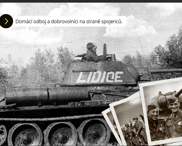
Domáci odboj a dobrovolníci na straně spojenců.